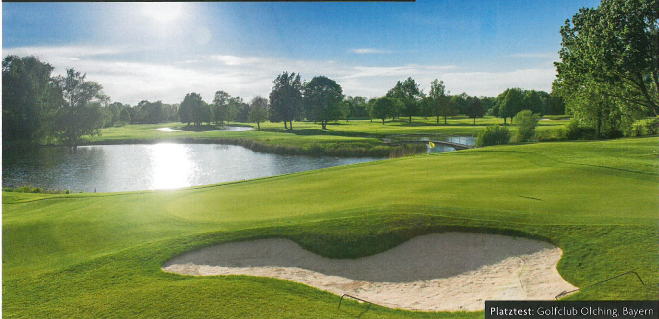
Platztest: Golfclub Olching, Bayern

Der gut 30 Jahre alte Platz im Westen Münchens war ja schon immer eine »Sportstätte« und keine Freizeitanlage. Doch das, was der Architekt Thomas Himmel bei der aufwendigen Generalüberholung in 2012/13 jetzt aus dem weitgehend flachen Gelände herausgeholt hat, ist wirklich bemerkenswert. Vor allem die Grüns, zuvor meist etwas beschaulich und eher platt, zeigen sich jetzt voller Leben. Die 18 komplett runderneuten Putt-Flächen sind größer geworden und oft kräftig onduziert – und bei Höhenunterschieden wie an Loch 12 würde sogar ein Rodel